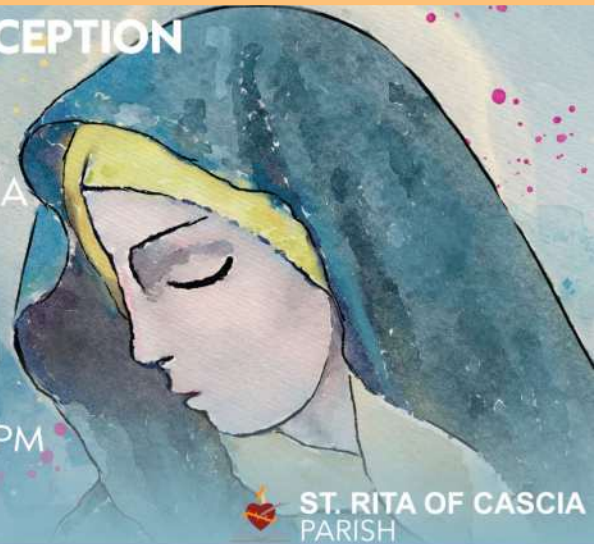
ST. RITA OF CASCIA PARISH